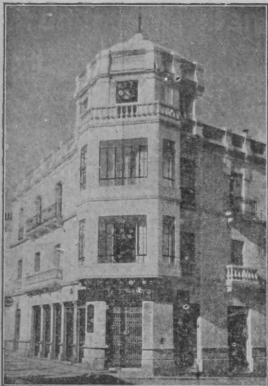
Sucursal en BAENA, P. de la Constitución, 19