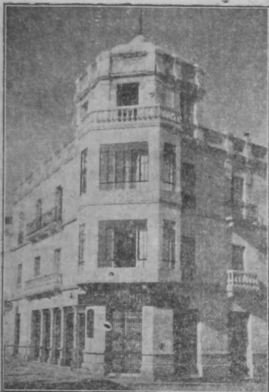
Sucursal en BAENA, P. de la Constitución, 19.