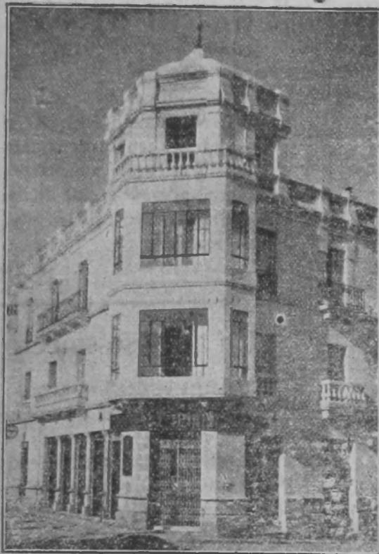
Sucursal en BAENA, P. de la Constitución, 19.