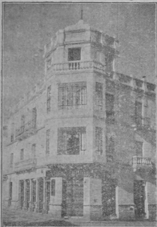
Sucursal en BAENA, P. de la Constitución, 19.