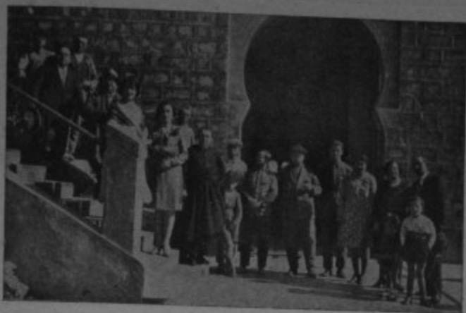
Ahí, frente a la puerta de la gran fábrica de electricidad de Mengemor, los excursionistas admiran la belleza del paisaje y piensan en el arroz con gallo muerto que les espera.