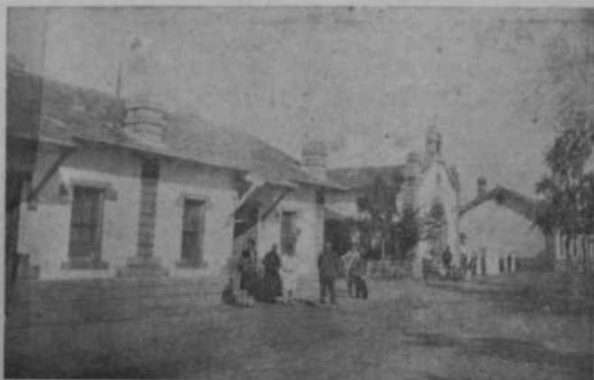
La Compañía Mengemor, tiene para sus empleados, junto al soberbio salto y fábrica, ese grupo de bellas casitas que invitan al optimismo y a la alegría.