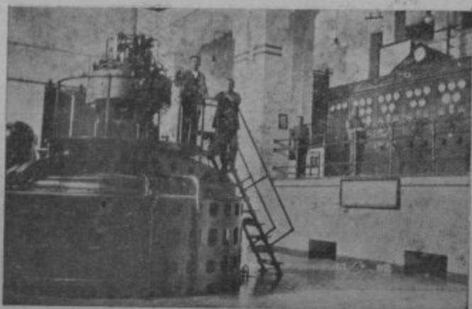
Una de las potentísimas turbinas que las aguas aprisionadas del Guadalquivir mueven en la grandiosa fábrica de Mengemor.