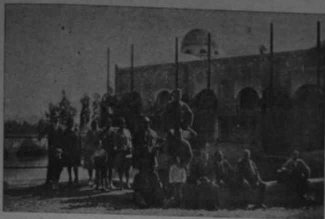
Por última vez, mientras el arroz cuece, posan los «perolófilos» junto al estanque de entrada a la soberbia fábrica, y en el que hay más peces que en el Mediterráneo.