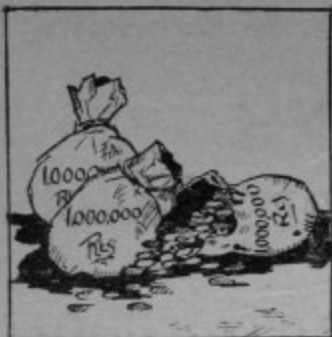
tres millones de reales