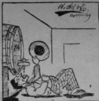
y un barril lleno de vino.