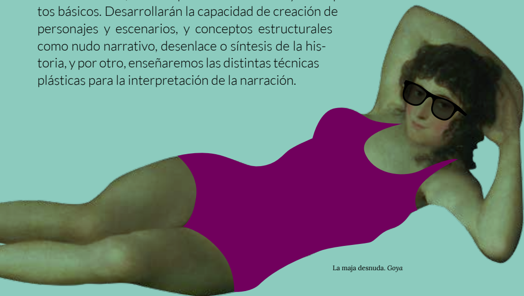
La maja desnuda. Goya

El taller pretende despertar el interés de los niños y niñas por los cómics, tanto en su faceta plástica como su vertiente narrativa, donde aprenderán técnicas y conceptos básicos. Desarrollarán la capacidad de creación de personajes y escenarios, y conceptos estructurales como nudo narrativo, desenlace o síntesis de la historia, y por otro, enseñaremos las distintas técnicas plásticas para la interpretación de la narración.