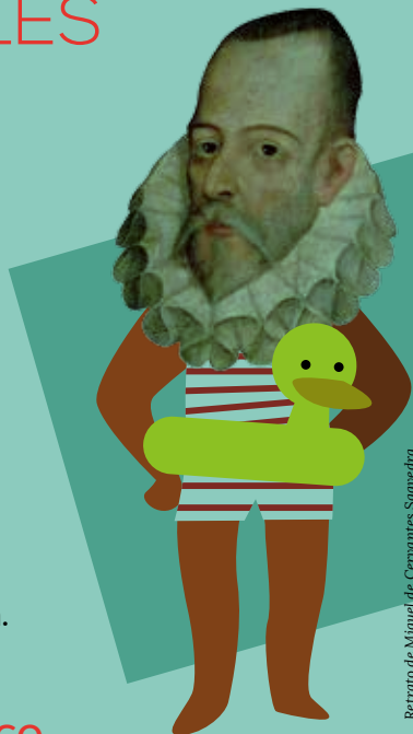
Retrato de Miguel de Cervantes Saavedra

Semana del 21 al 25 de julio, de 11.00 a 13.00 h.